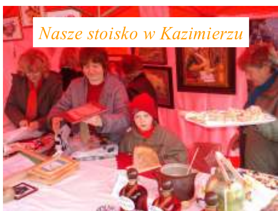
Nasze stoisko w Kazimierzu