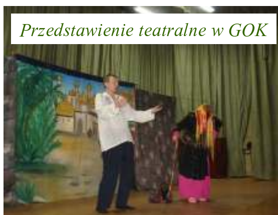
Przedstawienie teatralne w GOK