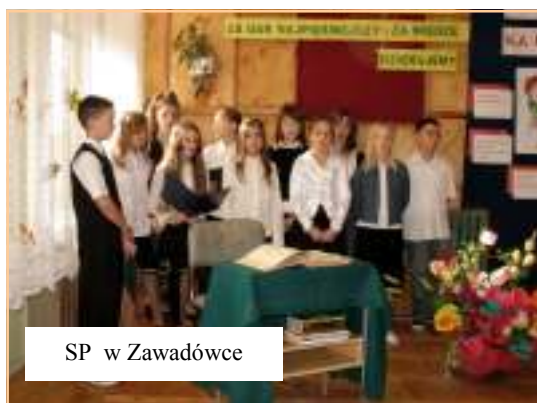
SP w Zawadówce