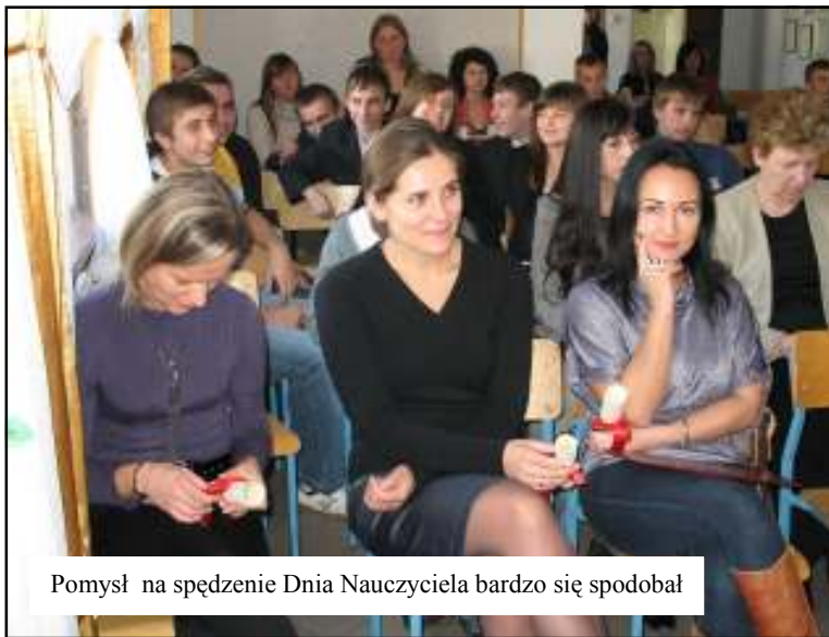
Pomysł na spędzenie Dnia Nauczyciela bardzo się spodobał