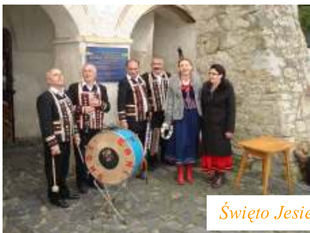
Święto Jesieni w Kazimierzu