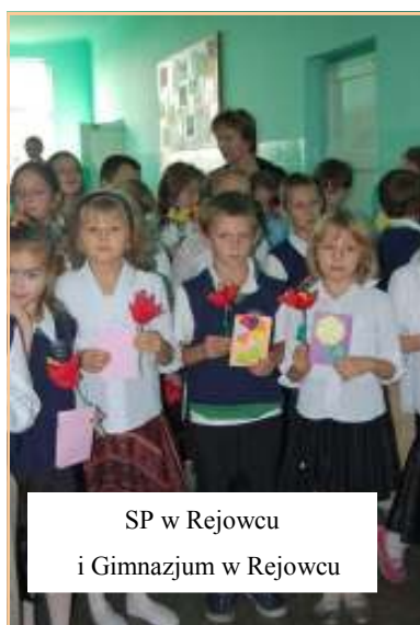
SP w Rejowcu i Gimnazjum w Rejowcu