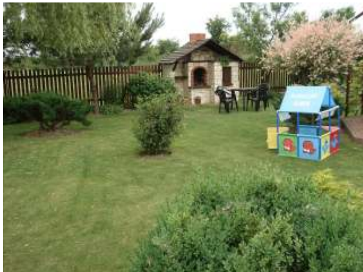
Dariusz Wiorko—I miejsce”