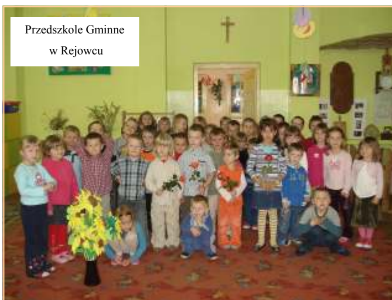
Przedszkole Gminne w Rejowcu