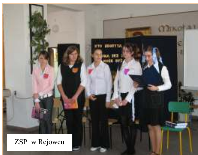
ZSP w Rejowcu